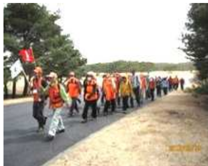
(海浜公園内をウォーク)

3月13日、TWC恒例の観梅ウォークが開催されました。例年ですと偕楽園での観梅ですが、今年は趣向を変えて「ひたち海浜公園」に変更しウォーキングを行いました。総勢71名(会員外31名)勝田駅に集合しストレッチ体操後、海浜公園目指して出発しました。出発直後より強い風が吹き出し、日本一美味しい干し芋の産地だけに収穫後の広大な畑から前方が見えなくなるほどの砂嵐で、花粉症の人には多量の花粉も飛散し大変なウォーキングでした。海浜公園に入ると白梅、紅梅、菜の花、水仙が満開で、とても綺麗でした。特にこの時期水仙は1haに100万本もの花が咲き誇り驚きの一言でした。昼食はあいにく休憩所が小さいため、各自風除けを探し、分散して済ませました。