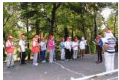
ウォーキング教室