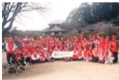
水戸観梅ウォーク