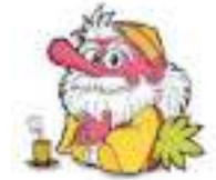
[かむてん] 新庄市の 公式イメージ キャラクター 神室山の天狗