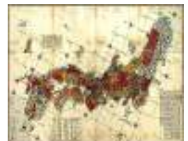
改正日本輿地路程全図

※ 陸前浜街道ウォークの1回目。今後、年に2~3回のペースでいわきまで歩く予定。