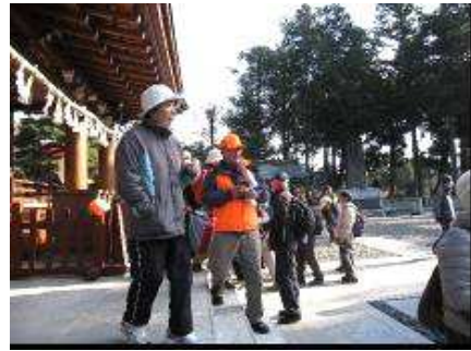
安良川八幡宮での参拝風景