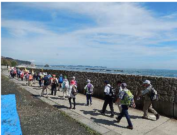
護岸工事中の磯原海岸を沿い歩く

ばかりの新しい北茨城市消防署で休憩。消防士の方が机に向かって勉強中? 久しぶりの良い天気農家の人も嬉しそうにコンバインの操作をしている。今年は雨が多く稲の収穫も遅れているとか。よう・そろーで昼食後、高萩ウォーキングクラブ 20回参加者の表彰式。午後は暑い中を里根川に沿って大津港駅に向かう。川のほとりや土手に真っ赤に咲いているヒガンバナに元気をもらい無事フィニッシュ。