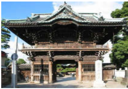
柴又帝釈天二天門

事前に連絡してくれればもう1艘用意したのと言われ反省しきり。この矢切の渡しは、江戸時代初期、地元民専用に対岸の農地の耕作や日用品購入、寺社参拝などのために、徳川幕府が設けた15の渡し場のうちのひとつであるが、今では東京近郊で定期的に運行されている渡しは、この矢切の渡しのみとのこと。渡河後、河川敷の矢切公園で昼食をとり、柴又帝釈天へ。この寺は江戸時代初期