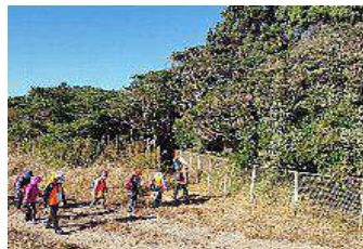
イブキ樹叢を一回り