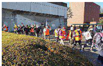
文化会館前をスタート

雲一つない晴天、暖かな陽射しが心地よいウォーキング日和。高萩市文化会館をスタートし、島名・石滝を経て、冬の花貫川沿い「あじさいロード」を歩く。紫陽花の季節にまた歩きたいという声も。