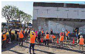
スタート前のストレッチ

風も無く穏やかな青空のもと、高萩市文化会館をスタート・フィニッシュとし、高浜海岸を経て国指定天然記念物(日立市)である「いぶき山イブキ樹叢」へのウォーキング。