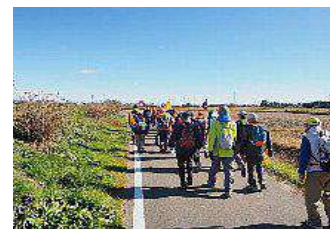
あじさいロードを行く(左手の土手に紫陽花)