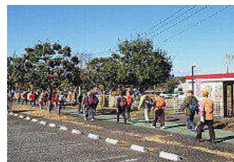
ソーシャルディスタンスをとって歩く