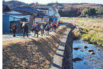
花貫川沿いを歩く