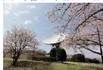
桜とパラボラアンテナ