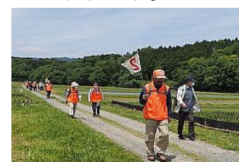
広々とした田園風景