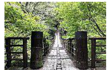
花貫溪谷 汐見滝吊り橋