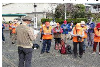
出発式でコースの説明

今日のメインは「さくら宇宙公園」。日頃の心がけのせいか満開の桜に出会え、皆さん笑顔が一杯です。