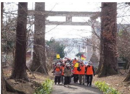
安良川八幡宮の参道

・天候：晴 参加者：40名(会員33名、会員外7名) (距離:7km) ・文化会館⇒高萩小学校⇒安良川八幡宮⇒向洋台児童公園⇒鏡神社⇒イオン⇒文化会館 本年も元気に、そして健やかに歩けることを祈願するための初詣ウォーク。 参加者全員で安良川八幡宮で初詣祈願した後、向洋台児童公園まで行きここで解散、コロナの状況を鑑み、密を避けるためここからは地図を見ての自由歩行としました。多くの皆さんが鏡神社に向かい参拝をしておりました。