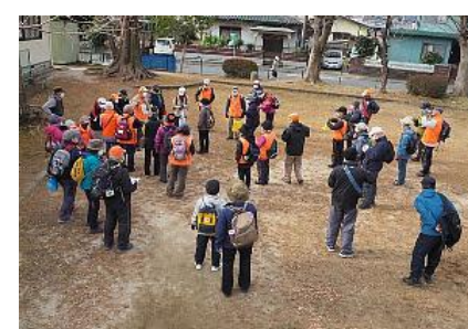
向洋台児童公園で解散