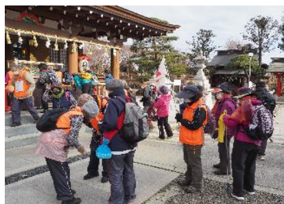
各自 今年も宜しく と祈願 (コロナが終息しますように)