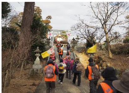
石段を登ると拝殿