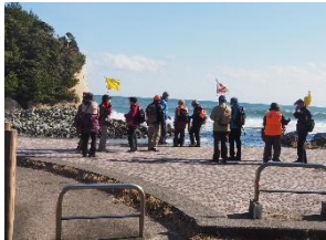
高戸小浜までウォーク