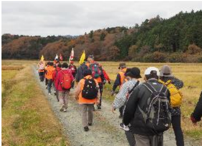
田園の中をのんびりと