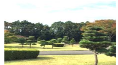
お手まき記念の森