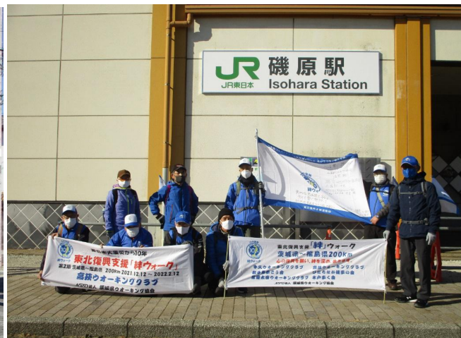
磯原駅前(フィニッシュ)