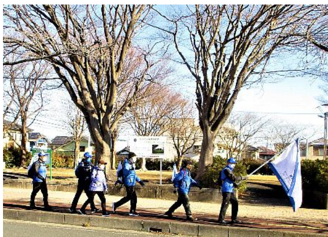
ウォーキング風景①