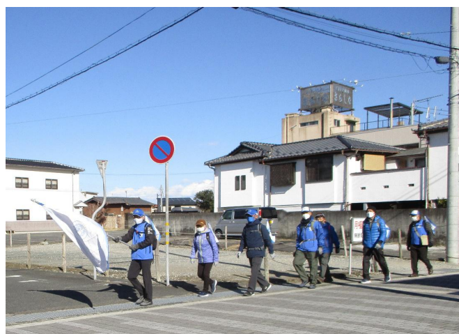
ウォーキング風景②