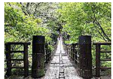
花貫溪谷 汐見滝吊り橋