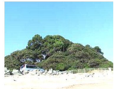
いぶき山イブキ樹叢