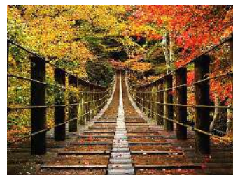
花貫溪谷 汐見滝吊り橋