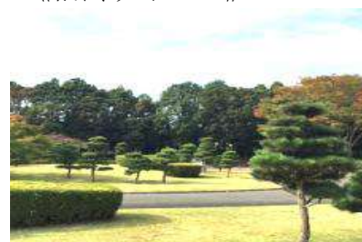
森林公園(お手まき記念の森)