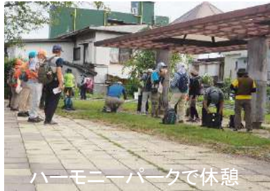
ハーモニーパークで休憩