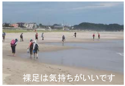
裸足は気持ちがいいです