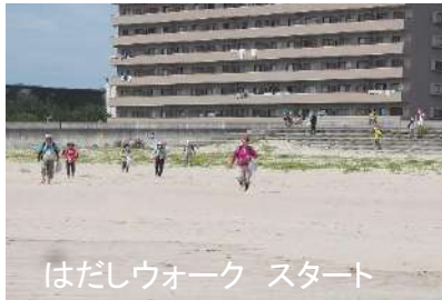
はだしウォーク スタート

関東一の白砂の砂浜といわれる高萩の海岸を裸足で歩く。そんな散策を楽しんで来ました。海の青、白い波頭の風景、心地よい砂浜の砂の感触を、皆さん、存分に味わっていましたよ。