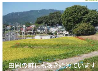
田圃の畔にも咲き始めています