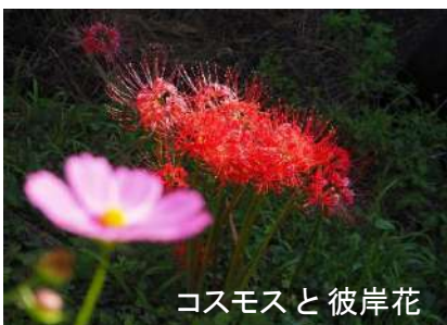
コスモスと彼岸花

緑陰の中に咲く彼岸花、色付き始めた田圃の畔の赤い彼岸花等々、咲き始めではありましたが仲秋のウォークを楽しんで来ました。