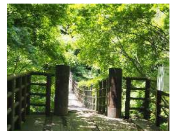
花貫溪谷 汐見滝吊り橋