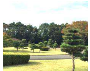
お手まき記念の森