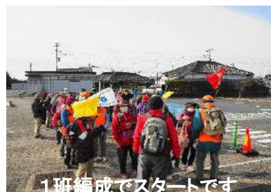
1班編成でスタートです

「松岡八景」は、文化年間(1804～1817)に、当時の領主中山信敬が儒学者 亀里亀章に場所を選ばせ 詩句をつけさせた処で、今回は六ヶ所を巡りました。42名の参加があり、盛会なウォーキングを楽しみました。また、最初の八景「能仁寺」では、住職ご夫妻より湯茶の接待をいただき、身も心もホットになりました。