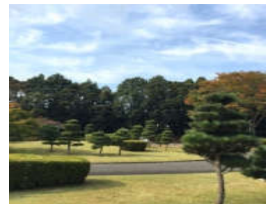
お手まき記念の森