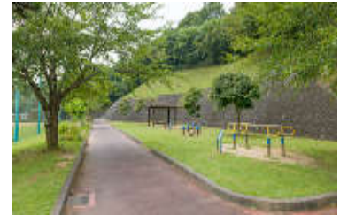
折笠スポーツ広場